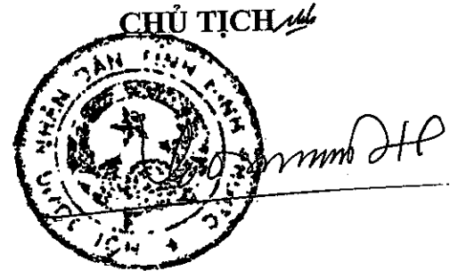
Trần Tuệ Hiền